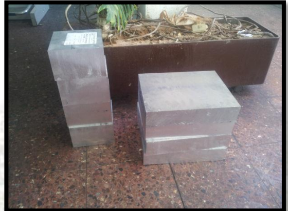
חומר גלם ל 4 מכלולי הגלגל אשר נתרם ע"י "כנפית" ונכנס כבר לייצור ב "הדייקן"