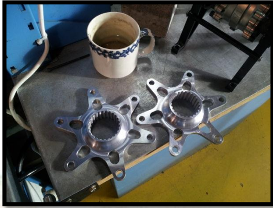
2 מתאמי דיפרנציאל שיוצרו ב "צור לבון"