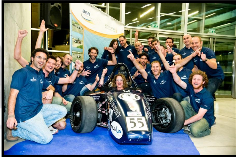
נשיאת האוניברסיטה פרופ' רבקה כרמי עם חברי הקבוצה