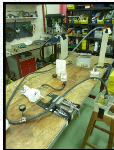
תמונות מניסוי מיכל דלק