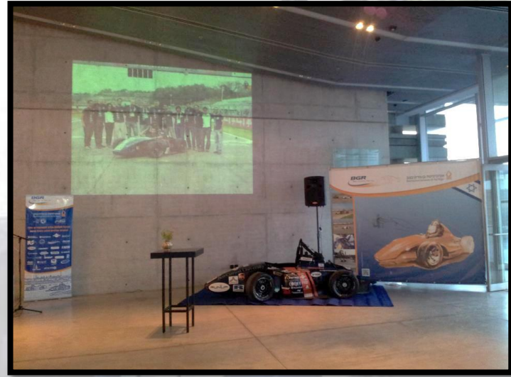
הרכב כפי שהוצג באירוע

הניסויים של הקבוצה ממשיכים בכל הכוח, החודש ביצענו עוד 2 ניסויים חשובים לתכן הרכב: