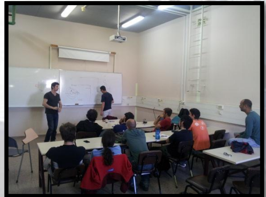
תמונות מהחלק הראשון בסדנת הכשרת נהגים

ולסיכום נעדכן כי תכנון הרכב של BGR 2013 נמצא בשלביו הסופיים, ניוזלטר חדש במהדורה מיוחדת וחגיגית יופץ בשבועות הקרובים בו יהיה מפורט התכנן הסופי של הרכב עם כל התוספות והחידושים שנוספו השנה, ויש המון!!